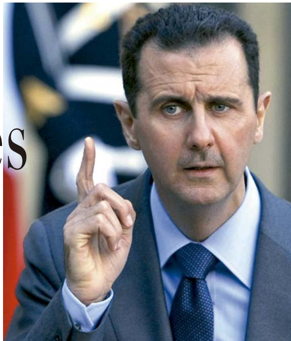
Bashar al Asad

Analizamos las claves de una guerra que dura ya cinco años.